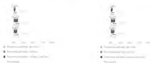
1. Ajuste a la taxonomía de las inversiones, incluidos los bonos soberanos* 2. Ajuste a la taxonomía de las inversiones, excluidos los bonos soberanos*

Los gráficos que figuran a continuación muestran en rojo el porcentaje mínimo de inversiones que se ajustan a la taxonomía de la UE. Dado que no existe una metodología adecuada para determinar la adaptación a la taxonomía de los bonos soberanos*, el primer gráfico muestra la adaptación a la taxonomía correspondiente a todas las inversiones del producto financiero, incluidos los bonos soberanos, mientras que el segundo gráfico muestra la adaptación a la taxonomía solo en relación con las inversiones del producto financiero distintas de los bonos soberanos.